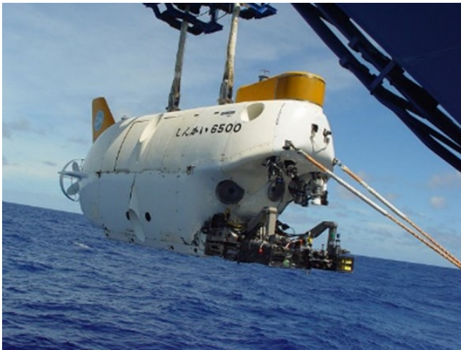
有人深海調査船「しんかい 6500」