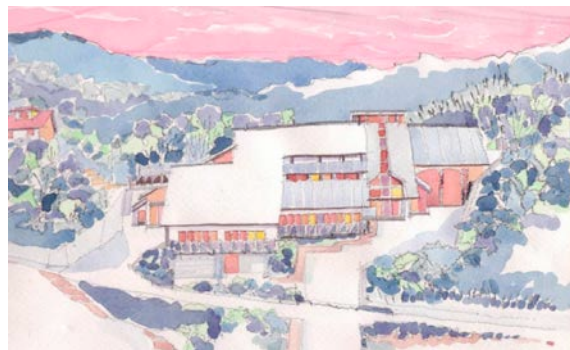
野外活動センター外観図(枚方市穂谷 4550 番地) http://www7.ocn.ne.jp/~hao/

枚方市穂谷地区の野外空間で子供達との「宇宙ふれあいキャンプ」を開催します。子供は好奇心に満ち活発で、自然に触れて知る様々な不思議に感動します。しかし最近は、日常生活の中でそのような機会がなかなか得られなくなってきました。子供たちが宇宙や地球の不思議に触れることをきっかけに自然や科学に興味を持ち、関心を高めてくれることを願って開くものです。小・中・高生、父兄、地域の皆さん、ぜひ、ご参加下さい。