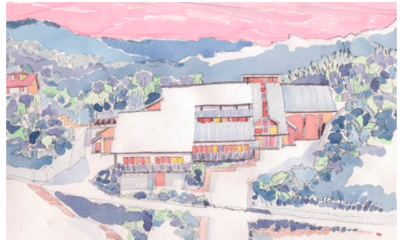
野外活動センター外観図(枚方市穂谷 4550 番地) http://www7.ocn.ne.jp/~hao/

枚方市穂谷地区の野外空間で子供達との「宇宙ふれあいキャンプ」を開催します。子供は好奇心に満ち活発で、自然に触れて知る様々な不思議に感動します。しかし最近、日常生活の中でそのような機会がなかなか得られなくなってきました。子供たちが宇宙や地球の不思議に触れることをきっかけに自然や科学に興味を持ち、関心を高めてくれることを願って開くものです。小・中・高生、父兄、地域の皆さん、ぜひ、ご参加下さい。